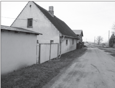
Ausbau: Straßenzustand – vorher

Der auf eine Verbesserung der Gemeindestraße angesprochene Bürgermeister stellte eine Überprüfung des Anliegens durch die Gemeinde in Aussicht. Vier Monate später ließ die Gemeinde die Aufpflasterung beseitigen, eine zumindest einseitige Entlastung für den Bürger.