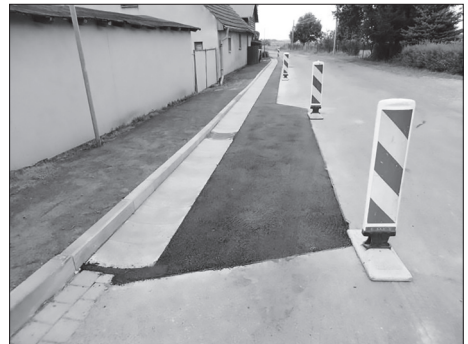
Zustand – nachher