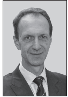
Matthias Crone Bürgerbeauftragter des Landes Mecklenburg- Vorpommern

Aber auch politische und gesellschaftliche, oft streitige Themen haben den Weg zum Bürgerbeauftragten gefunden: Gebiete für Windenergieanlagen, Bürgerbeteiligung in den Kommunen, die Ganztagsverpflegung in Kindertageseinrichtungen, Abbau von