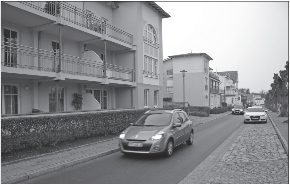
Ostseebad: Kein Platz für Ferienwohnen?

Der Bürgerbeauftragte bat den Landkreis um Überprüfung der getroffenen Entscheidungen. Dabei legte er seine Rechtsauffassung unter Benennung jeder einzelnen Besonderheit mehrfach schriftlich dar und führte Gespräche. Der Landkreis hat eine Genehmigung abgelehnt. Es seien die Grundzüge der Planung berührt. Auf die relevanten Besonderheiten in diesem Fall ging der Landkreis nicht ein. Der Bürgerbeauftragte hat nun eine förmliche Empfehlung gemäß § 7 Absatz 6 PetBüG M-V mit dem Inhalt ausgesprochen, dem Petenten die begehrte Genehmigung zur Nutzung der in seinem Hause gelegenen Einliegerwohnung zu Ferienwohnzwecken zu erteilen. Die Empfehlung ist dem zuständigen Mitglied der Landesregierung zugeleitet worden, das den Fall auf Recht- und Zweckmäßigkeit prüfen soll.