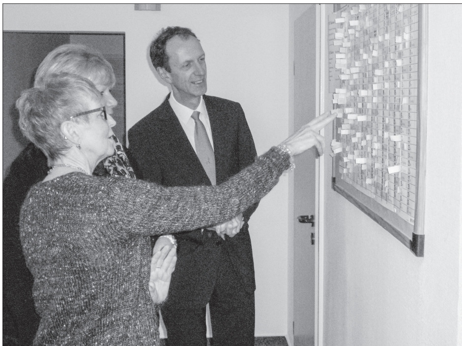
Besuch im Seniorenzentrum

Petitionen zur Rentenversicherung betrafen oft Fragen nach der individuellen Rentenhöhe. Vor allem aber wurden Probleme um die gesetzlichen Voraussetzungen für die Gewährung einer Erwerbsminderungsrente angesprochen. Oft liegen die medizinischen Voraussetzungen dazu vor, ohne dass die versicherungsrechtlichen, wie zum Beispiel die Belegung bestimmter Zeiträume mit Pflichtbeitragszeiten, gegeben sind. Für die Bürger sind die einschlägigen gesetzlichen Vorschriften