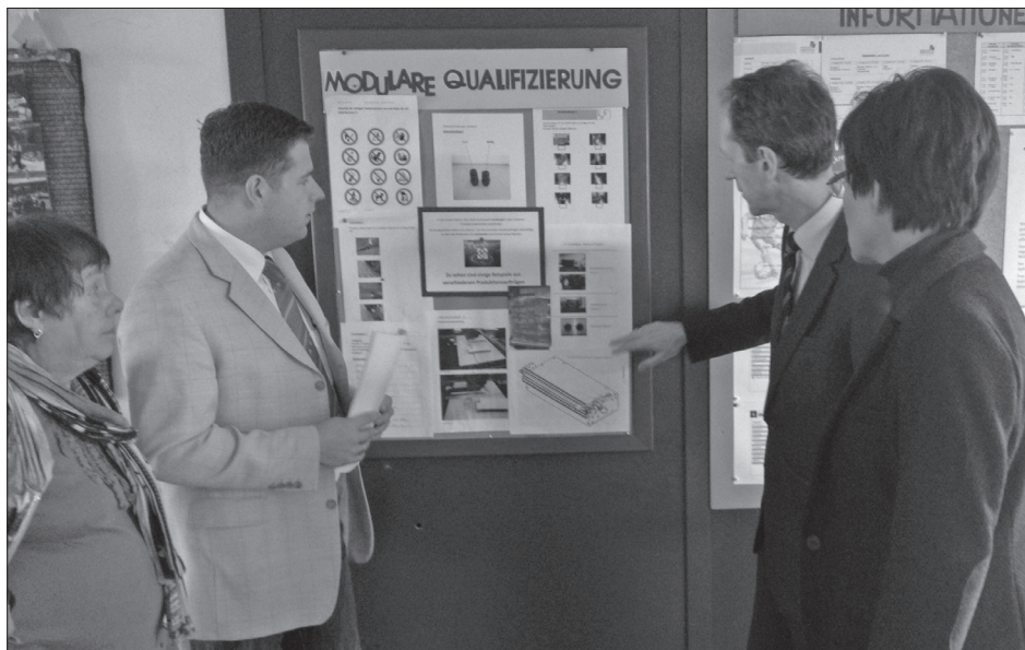
Qualifizierung: Bessere Chancen für Arbeit

Ein wichtiger Grund im Sinne des Gesetzes liegt vor, wenn dem Arbeitnehmer unter Berücksichtigung aller Umstände des Einzelfalles und unter Abwägung seiner Interessen gegen die Interessen der Versichertengemeinschaft ein anderes Verhalten nicht zugemutet werden kann. Als wichtige Gründe kommen berufliche, betriebliche und persönliche Umstände in Betracht. Ein wichtiger Grund kann auch vorliegen, wenn die Arbeitsplatzaufgabe erfolgte, um zum zukünftigen Ehepartner zu ziehen. Das ist der Fall, wenn die Eheschließung in absehbarer Zeit beabsichtigt ist.