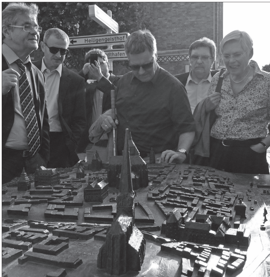
Rostock barrierefrei: Stadtmodell ist antastbar.

Ob und wann auf diesem Weg gerechte Regelungen gefunden werden, ist nicht absehbar. Das Bundesland Mecklenburg-Vorpommern sollte im Rahmen seiner Mitwirkung in der ASMK auf eine schnelle Erarbeitung konkreter Lösungsvorschläge hinarbeiten.