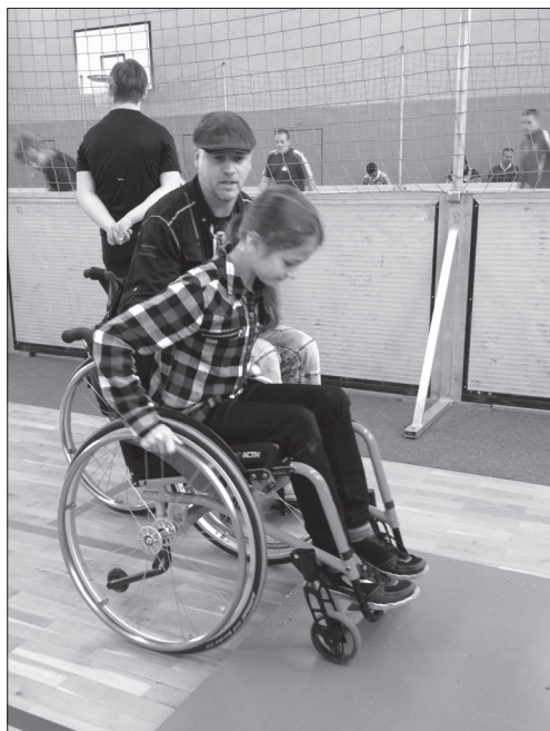
Schon kleine Absätze sind Barrieren

Der größte Teil von ihnen bezog sich auf Feststellungsverfahren bei der Schwerbehindertenanerkennung nach § 69 SGB IX (51; 2013: 40).