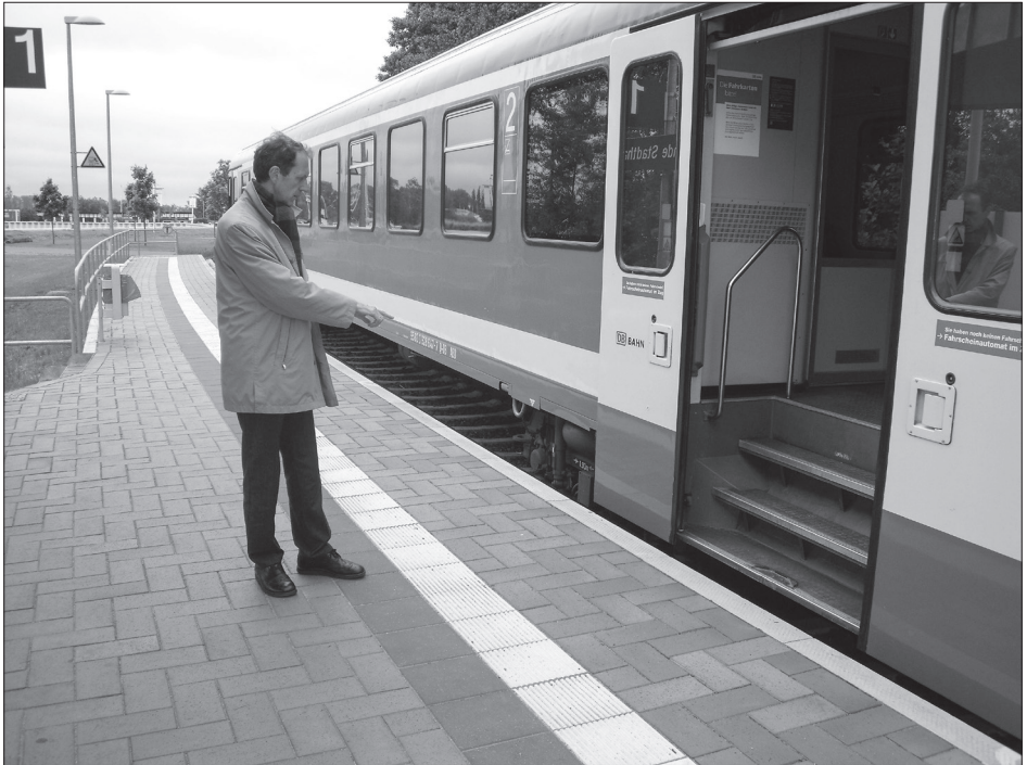
Nicht barrierefrei: Zug in Ueckermünde