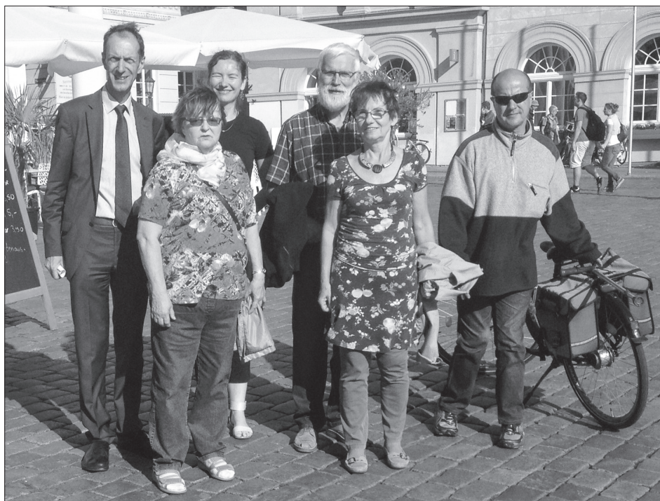
Probe: Barrierefreier Stadtrundgang mit Bürgern

Zusätzlich wurden die Medien über die Arbeit und die Möglichkeiten des Bürgerbeauftragten regelmäßig informiert. Mittlerweile hat sich ein Pressegespräch im Abstand von sechs Monaten bewährt. Die Medienvertreter erhielten jeweils einen Halbjahresüberblick über die