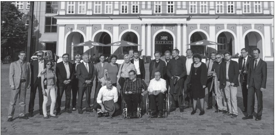
Treffen der Beauftragten mit der BAR in Rostock

Beim 47. Treffen der Beauftragten für die Belange von Menschen mit Behinderungen von Bund und Ländern mit der Bundesarbeitsgemeinschaft für Rehabilitation (BAR) im Mai 2014 in Rostock war der Bürgerbeauftragte Gastgeber und Vorsitzender der Tagung. Zentrales Thema der Tagung war die Zusammenschau der Reformen von gesetzlicher Pflegeversicherung und der Eingliederungshilfe für Menschen mit Behinderungen durch ein Bundesteilhabegesetz. Die Beauftragten haben sich in ihrer Rostocker Erklärung dafür ausgesprochen, beide Reformen zeitlich und inhaltlich zu einem Gesamtkonzept zu verbinden. Das Recht auf Teilhabe und unabhängige Lebensführung müsse auch bei Pflegebedürftigkeit gesichert sein.