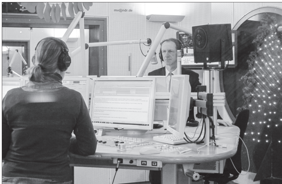
Im Interview: Aktion des NDR „Hand in Hand“

in einer Reihe von Fällen nur schleppend nachgekommen. Obwohl in Abstimmung verlängerte Antwortfristen eingeräumt oder sogar mündliche Zwischenmitteilungen zum Sachstand akzeptiert werden können, mussten 186 förmliche Mahnungen erteilt werden.