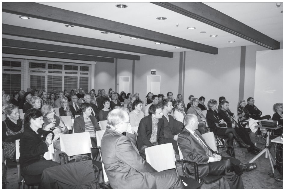
Fachtagung in Stralsund

Diese Veranstaltung zur beruflichen Inklusion wurde durch eine öffentliche Präsentation zu Behinderungen und Barrieren, aber auch zu Erfolgsgeschichten von Menschen mit Behinderungen in Arbeit und Beruf ergänzt.