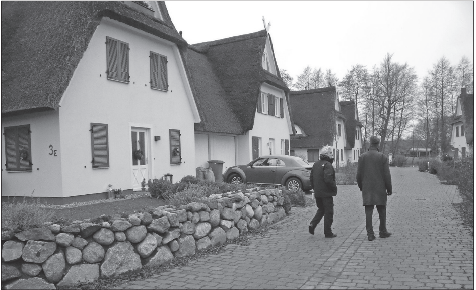
Zweitwohnen oder Ferienwohnen? Das ist hier die Frage.

Kommunales Studieninstitut des Landes Mecklenburg-Vorpommern ein Seminar für Vertreter der unteren Baubehörden und der Gemeinden zu dem Thema „Dauerwohnen und Ferienwohnen – was geht da noch?“ organisiert, das wegen hoher Nachfrage wiederholt werden muss.