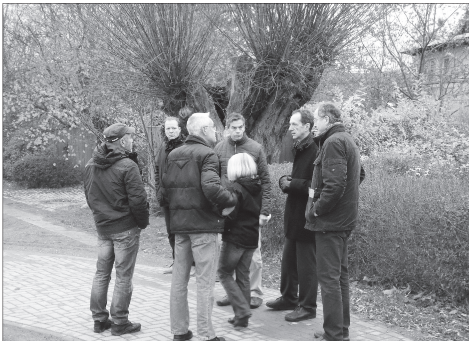
Oft nötig: Ortstermin zu Straßenproblemen

In vielen Situationen empfinden Anwohner den Verkehr subjektiv als sehr belastend und gesundheitsgefährdend. Die sogenannte objektive Bewertung durch die Verkehrslärberechnung (ohne Messung) führt aber in vielen Beschwerdefällen dazu, dass die erhofften verkehrsrechtlichen Anordnungen nach den geltenden Richtlinien nicht geboten sind. Trotzdem können Verbesserungen in manchen Situationen erzielt werden.