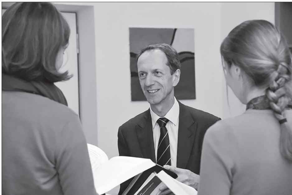
Der Bürgerbeauftragte in der Beratung.