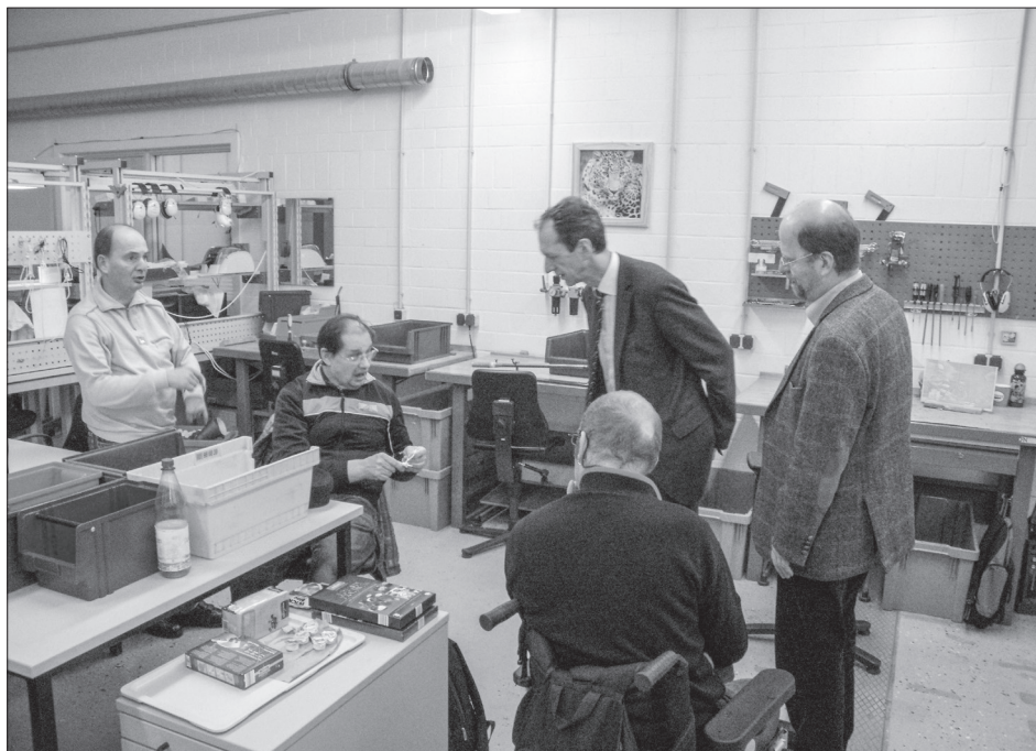
Besuch der WfB Stralsund

Das Ergebnis seiner Recherchen trug der Bürgerbeauftragte dem KSV vor. Er wies darauf hin, dass nach geltendem Recht bedarfsgerechte Lösungen für Menschen mit Behinderungen zu finden seien. Gegebenenfalls müsse man einen besonderen Leistungstyp für Tagesstätten dieser Art schaffen. Der Verbandsdirektor des KSV entgegnete, dass zwar in diesem Fall tatsächlich eine besondere Situation vorliege, auf der anderen Seite aber kein neuer Leistungstyp geschaffen werden könne. Hier müsse der Einzelfall gelöst werden.