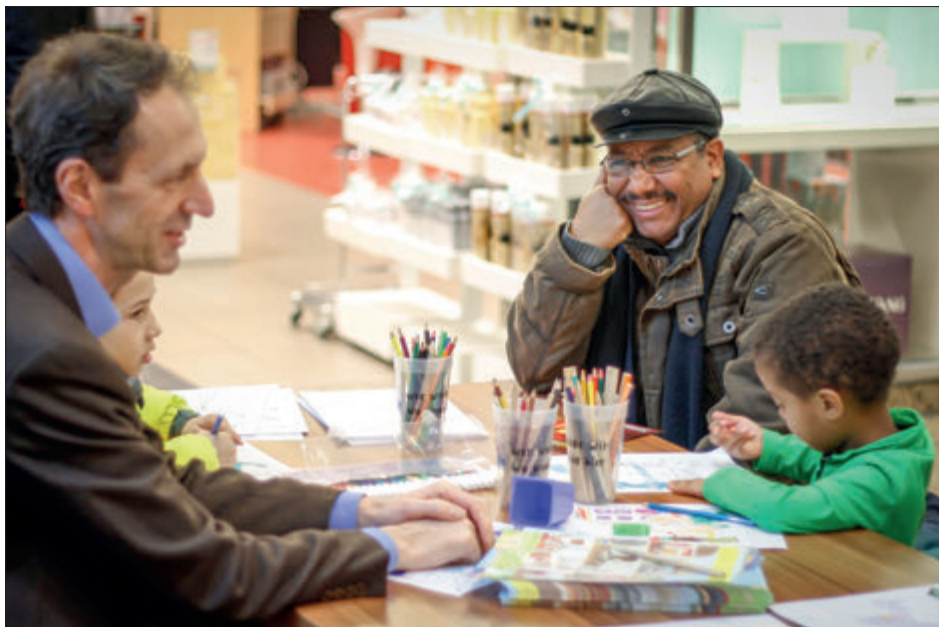
Schlosspark-Center: Aktionstag WIR. Erfolg braucht Vielfalt

Die Öffentlichkeitsarbeit des Bürgerbeauftragten umfasste wieder die Mitwirkung an Demokratie- und anderen Publikumsveranstaltungen. Durch Besuche in allgemeinbildenden Schulen stellte er jungen Menschen das Petitionsrecht vor und zeigte die Gestaltungsmöglichkeiten, die dieses Recht bietet, auf. In weiteren Veranstaltungen und Beratungen mit Bürgerinitiativen, Verbänden, Organisationen und Beiräten – vor allem mit Vertretern der Selbsthilfe von Menschen mit Behinderungen – stellte er sich den Fragen und informierte über Rechte der Bürger sowie Unterstützungsmöglichkeiten des Bürgerbeauftragten.