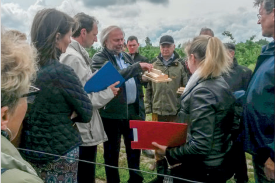
Stimmt das Gefälle? – Beratung mit Bürgern und Behörden vor Ort

In den ersten Jahren habe sich die Zusammenarbeit mit der Bürgerinitiative sehr gut gestaltet. Jedoch seien die Gespräche im September 2014 durch die Stadt während der Bauarbeiten abrupt abgebrochen worden. Auf Nachfragen und weitere Hinweise habe es dann keine Reaktionen und keine Gesprächsangebote mehr gegeben.