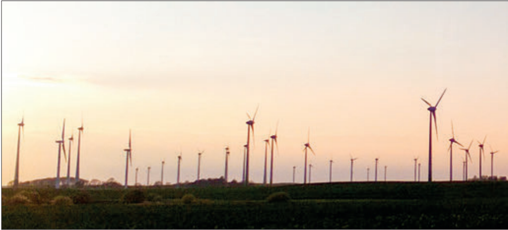
Löst Emotionen aus: Windpark

Exemplarisch ein Fall aus Westmecklenburg: Dort beklagte die Petentin mangelnde und verweigerte Informationen zu möglichen Windkraftanlagen in der Nähe des Dorfes. Potentielle Investoren mit eindeutigen Werbeaufschriften auf ihren Autos waren mehrfach gesehen, Bürger mit Grundbesitz bereits angesprochen worden, um Vorverträge für die Flächennutzung abzuschließen. Ein Investor wurde im Gespräch mit der Bürgermeisterin angetroffen. In der darauf folgenden Gemeindevertretersitzung hätten Bürger kritische Fragen gestellt. Diese seien nicht oder ausweichend beantwortet worden.