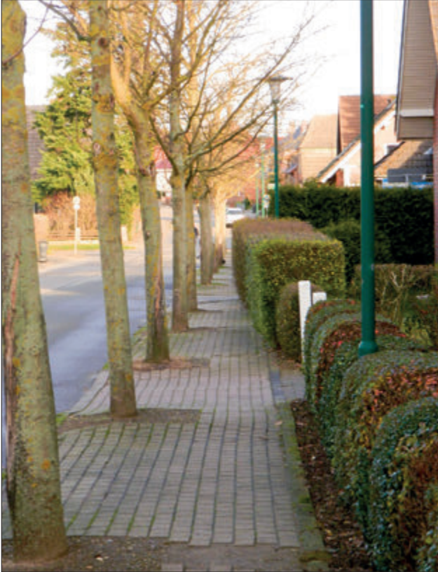
Gehweg in Lübz

Der Bürgerbeauftragte konnte der Petentin, nachdem er sich beim zuständigen Landkreis erkundigt hatte, wenige Wochen später berichten, dass die Fällgenehmigung erteilt worden sei und somit die Wiederherstellung des Gehweges nun bald erfolgen werde. Im Zuge des Vororttermins konnten zudem auch die Probleme der Petentin bei der Überquerung von anderen Straßen angesprochen werden.