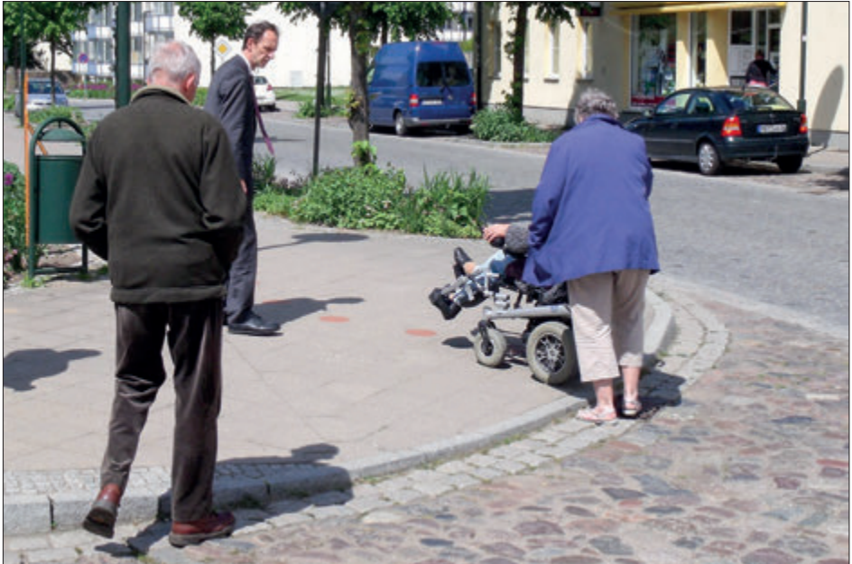
Rollstuhlfahrerin in Woldegk