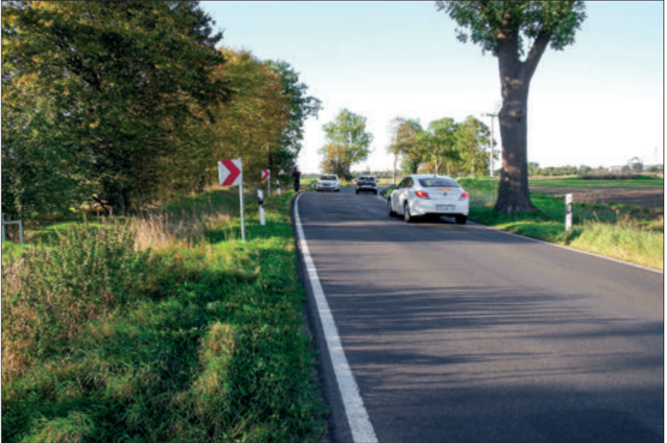
Gefährliche Straße als Schulweg

Der Bürgerbeauftragte wandte sich an den zuständigen Fachdienst des Landkreises und teilte seine Einschätzung mit. Nach kurzer Prüfung im Landkreis erhielten alle Schüler des Ortsteils eine Fahrkarte für das gesamte Schuljahr.