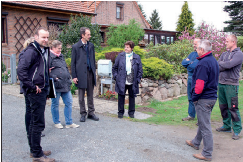
Beratung mit Bürgern vor Ort: Straßenbau

Zu einer erneuten Beschwerde im Jahr 2015 teilte der Landkreis auf Nachfrage des Bürgerbeauftragten mit, dass die Prioritätenliste noch nicht vorliege. In den zurückliegenden Jahren seit der Kreisgebietsreform sei es notwendig gewesen, ein Viertel des ingenieurtechnischen Personals der Straßenbauverwaltung für die Bewertung des Infrastrukturvermögens einzusetzen. Diese Arbeiten dienen der Aufstellung der Eröffnungsbilanz des Landkreises, wie sie im neuen Haushaltsrecht vorgeschrieben wird. Mit dem vorhandenen Personalbestand sei eine Fortschreibung der Prioritätenliste nicht möglich gewesen. Zusätzliches Personal hierfür könne nicht akquiriert werden. Auch hier erfolgte der Hinweis auf die entsprechende Finanzlage des Kreises.