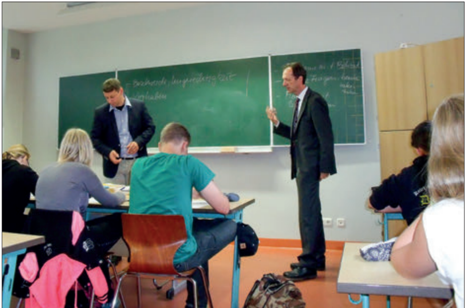
Bürgerstunde hautnah: Bürgermeister und Bürgerbeauftragter im Unterricht

Im Bereich Bildung, Wissenschaft und Kultur ist 2015 die Frage der Schülerbeförderung wieder verstärkt ins Blickfeld gerückt. Die Zahl dieser Petitionen erhöhte sich deutlich. Grund hierfür war insbesondere die geplante Abschaffung freiwilliger Zuschüsse von Landkreisen für die Fahrten zu örtlich nicht zuständigen Schulen. Eltern beklagten sich auch mehrfach über gefährliche Schulwege ihrer Kinder. Ebenfalls spielten Probleme bei der Schulwahl und den Schuleinzugsbereichen sowie Fragen der praktischen Umsetzung der Inklusion immer wieder eine Rolle.