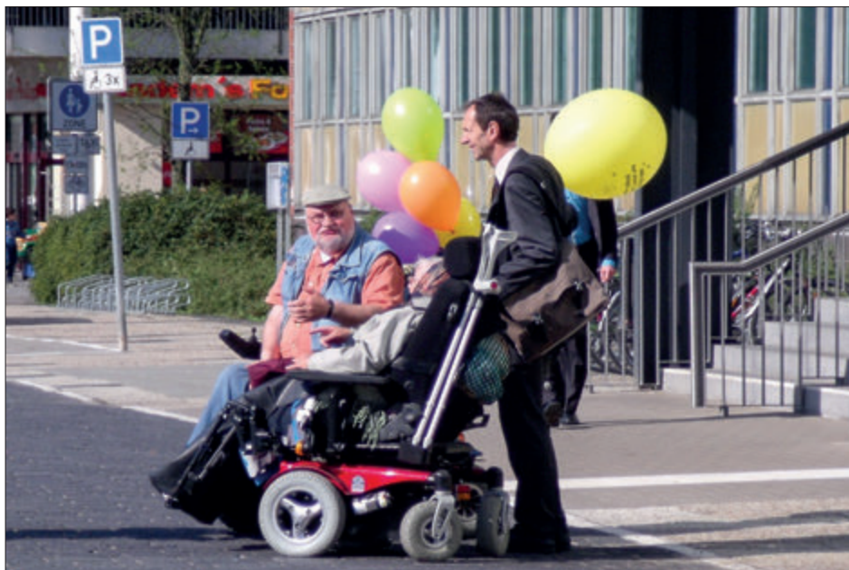
Beim Neubrandenburger Aktionsbündnis

andere Fragen der Barrierefreiheit. Kritisch wurde die Umsetzung von Vorschriften zur Barrierefreiheit im Baugenehmigungsverfahren beleuchtet. Nach dem Eindruck der Behindertenvertreter fehlt es in den Behörden und auch bei den Bauvorlageberechtigten immer noch an Kenntnissen über die einschlägigen technischen Bestimmungen. Die Beteiligung von Behindertenbeauftragten oder -beiräten ist zwar wichtig, kann aber eine in die Tiefe gehende und rechtsverbindliche Prüfung durch dazu berufene Fachleute nicht ersetzen. Das gilt auch für den bestimmungsgemäßen Einsatz von Fördermitteln.