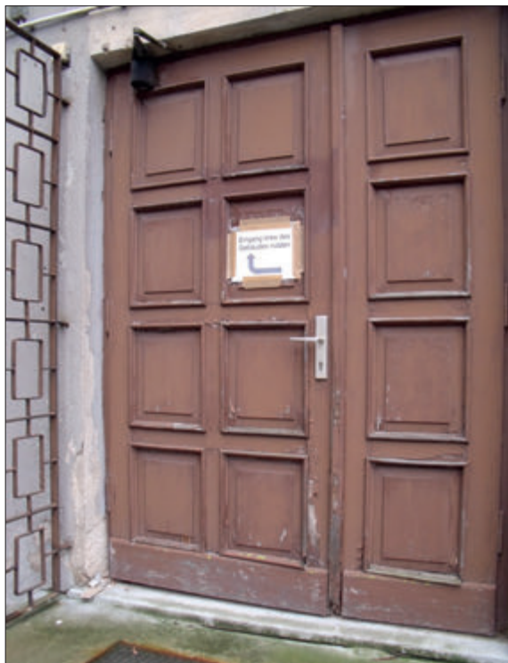
Alter Eingang der Polizeiinspektion in Stralsund

Im Zuge der Bearbeitung der Petition konnte der Bürgerbeauftragte beim Innenministerium erreichen, dass der Haupteingang an eine Tür ohne Stufen verlegt wurde. Zu den übrigen Kritikpunkten teilte das Ministerium allerdings mit, dass die benannten Polizeidienststellen in absehbarer Zeit aufgegeben würden. Deswegen sollten dort keine weiteren Investitionen zur Herstellung der Barrierefreiheit in den Gebäuden mehr erfolgen.