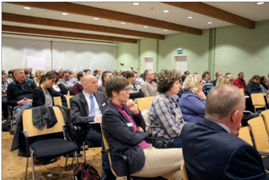
Interessiert – Gäste der Fachveranstaltung in Stralsund