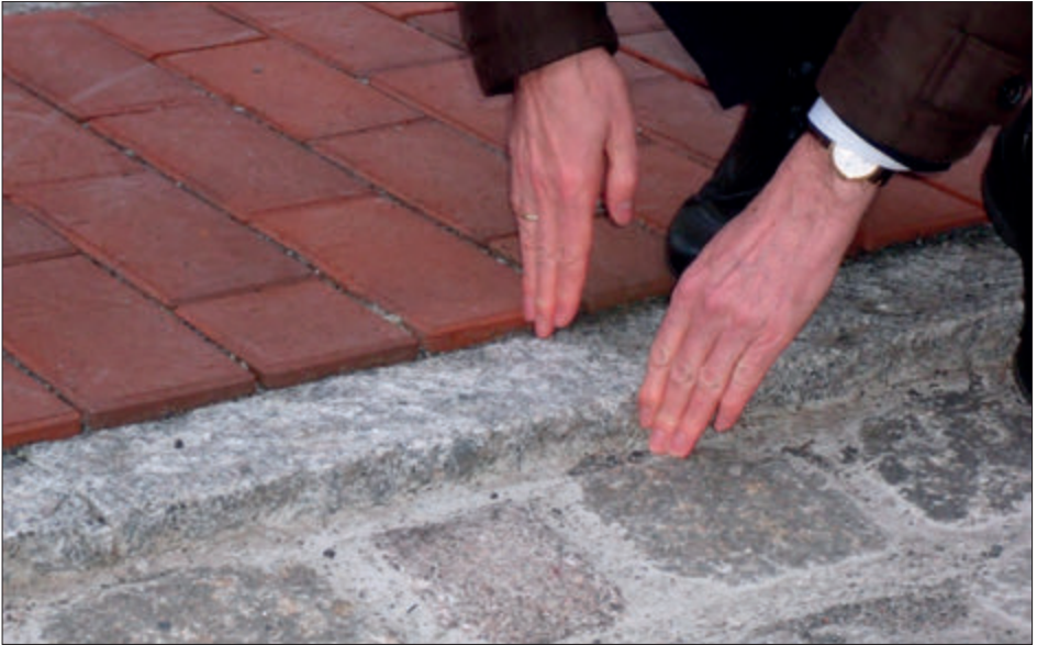
Granitkante am Bordstein

Der Bürgerbeauftragte wandte sich an die Stadt und wies auf die bestehende Verkehrssicherungspflicht für die öffentlichen Verkehrsflächen der Stadt hin. Da es hier vor allem auch um die optische Barrierefreiheit gehe, sollten weitergehende Maßnahmen zur Kennzeichnung und Kennbarmachung der Absätze von den Gehwegen zur Straße geprüft und verfolgt werden. Dies könne durch farbliche Kontraste erfolgen.