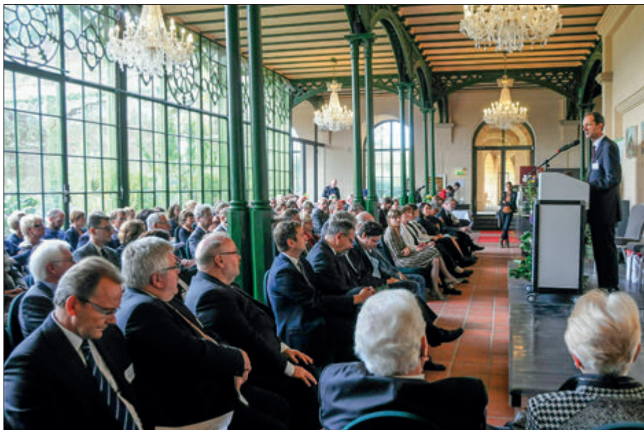
Gut besucht: Fachveranstaltung zum Jubiläum