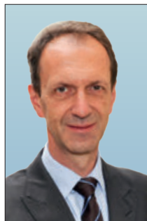
Matthias Crone Bürgerbeauftragter des Landes Mecklenburg- Vorpommern

Das alles ist nicht neu – die Themen nicht und das Verlangen nach Vereinfachung und Bürgernähe auch nicht. Neu – oder doch in Art und Ausmaß verändert – sind Ärger, Unmut und Verdruss, die erst