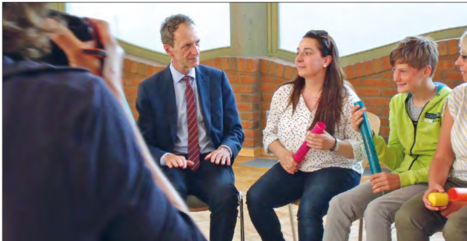
Musik und Rhythmus: Förderunterricht