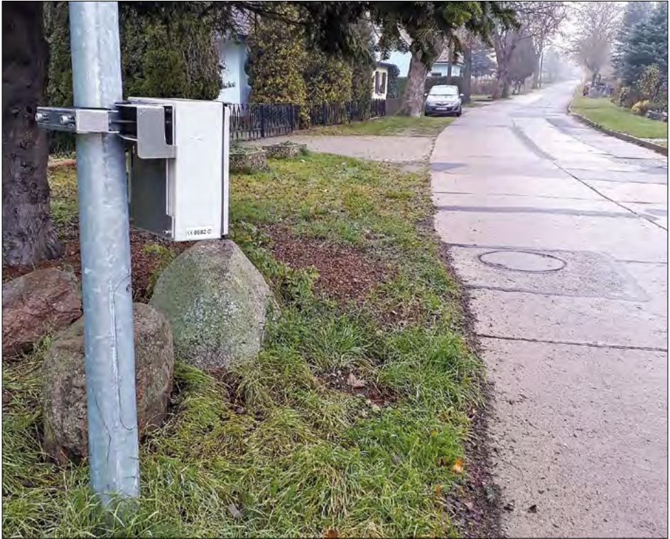
Objektiv: verdeckte Messung