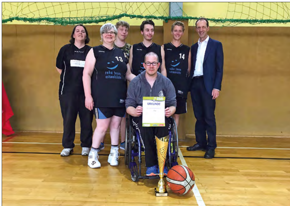
Gesiegt: Rollstuhlbasketballer aus Stralsund