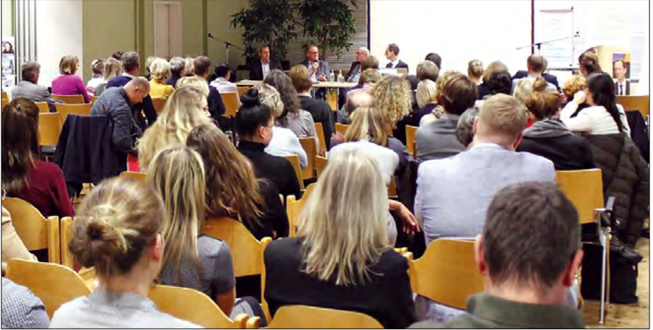
Belebt: Fachtagungen mit Arbeitsagenturen