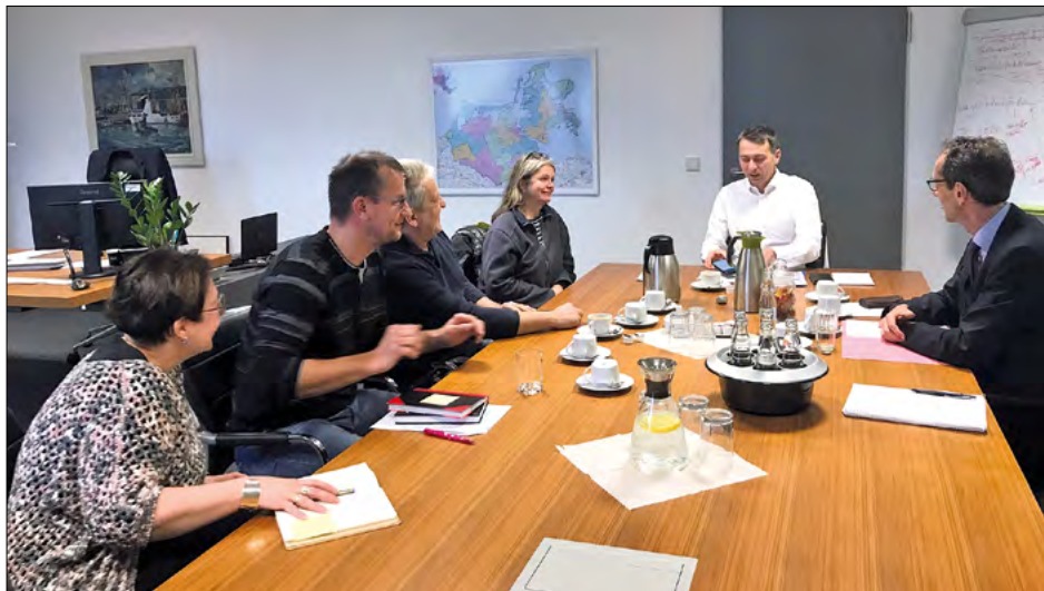
Gemeinsam: Sprechstunde mit dem Landrat

gerbeauftragte nutzte die Termine in der Regel auch dazu, Probleme und Anliegen mit den Verantwortlichen direkt zu beraten und Lösungen zu finden sowie Ortstermine durchzuführen.