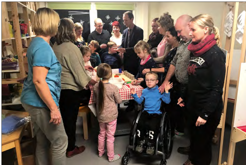
Gefördert: Hort im Förderzentrum