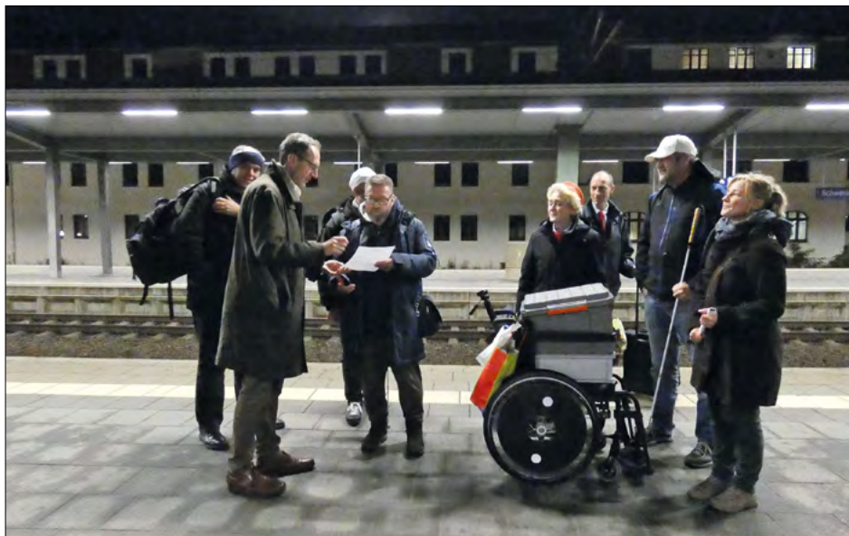
Barrierefrei: Test bei der Bahn