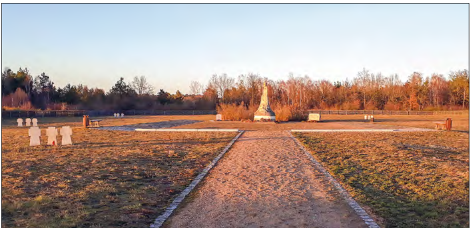
Umgestaltung wartet: Ehrenmal bei Parchim

Auch bei genehmigten Eingriffen muss die UNB aktiv die Umsetzung von Kompensationsmaßnahmen begleiten. So war in der Nähe eines Flughafens ein Birkenhain auf dem Gelände eines Ehrenmals und Friedhofs für Kriegsgefangene aus Gründen der Flugsicherheit gerodet worden. Die Kompensation für diesen Eingriff und auch die würdige Gestaltung des