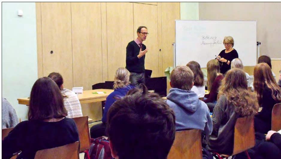
Interessiert: Schulklasse in Karlshagen