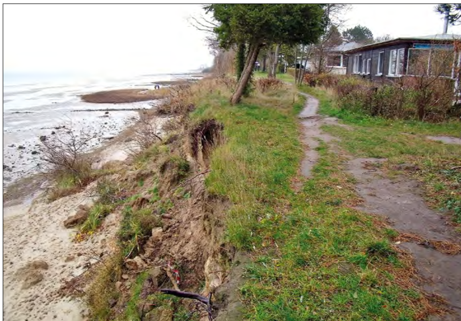
Gefährlich: Ortsteil am Kliff

Im Zuständigkeitsbereich des Agrarausschusses wurden 2019 insgesamt 103 Anliegen an den Bürgerbeauftragten herangetragen. Damit ist das Aufkommen nahezu gleichbleibend (2018: 101). Auch bauliche und planungsrechtliche Anfragen fallen hierunter, wenn Umweltrecht besonders betroffen ist. Fragen zur Infrastruktur, die ihren Schwerpunkt zum Beispiel in der Regenentwässerung hatten, werden ebenfalls in diesem Bereich statistisch erfasst.