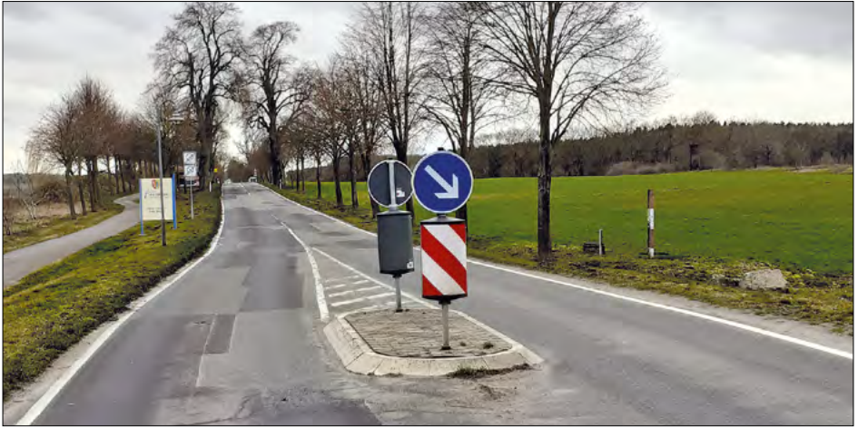
Gewünscht: Beruhigung durch Verlangsamung