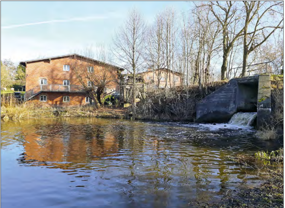
Schwierig: Denkmalschutz für Wassermühlenbetrieb

Der Bürgerbeauftragte hofft, dass mit diesem Vorgehen zukünftig die Pflicht zur Erhaltung von Denkmälern besser erfüllt werden kann.