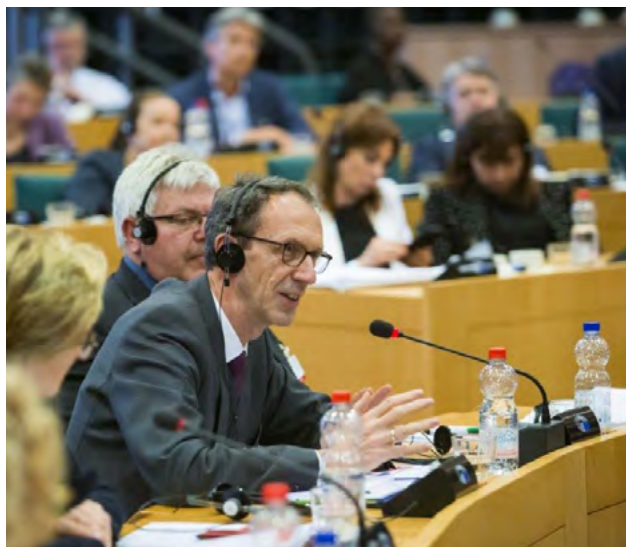
Vernetzt: Ombudsleute Europas