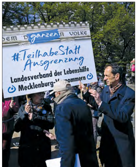
Protest: Für Menschen mit Behinderung

Mit der Schirmherrschaft und der Beteiligung an der inhaltlichen Vorbereitung und Durchführung einer Demonstration der Lebenshilfe e. V. „10 Jahre UN-BRK“ in Schwerin hob der Bürgerbeauftragte behindertenpolitische Anliegen hervor. Er drang auf den Abschluss des Landesrahmenvertrags und auf die Verabschiedung eines neuen Maßnahmenplans der Landesregierung zur Umsetzung der UN-BRK.