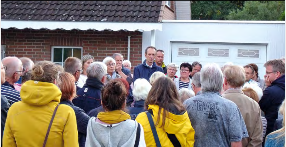
Gefragt: Aufklärung zum Straßenbau