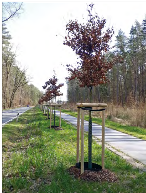
Kompensiert: Ersatzpflanzungen am Radweg

Im Mai 2019 schickte der Petent Bilder von der Ersatzpflanzung. Sie zeigten überwucherte Stecklinge, die zum Teil schon abgestorben waren. Trotz des schlechten Zustandes habe eine Mitarbeiterin der UNB erklärt, dass man keine weiteren Maß-