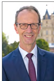
Matthias Crone Bürgerbeauftragter des Landes Mecklenburg- Vorpommern

Warten: Ein Thema aller Jahre. Warten auf Auskunft, auf Reaktion, auf einen Termin, auf Entscheidungen. Warten und Dauer gehören zu einem Verwaltungsverfahren, natürlich. Aber überlange Fristen, fehlende Zwischenbescheide, ausbleibende Informationen müssen nicht sein. Schon gar nicht ohne Erklärung.