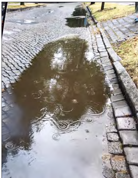
Unter Wasser: Straßensanierung muss warten

Den Bürgerbeauftragten erreichten erneut rund 60 Eingaben zu kommunalen Gebühren und Beiträgen. Zwar wurden inzwischen die Straßenausbaubeiträge durch landesgesetzliche Regelung abgeschafft. Dies betrifft aber nur Maßnahmen, die ab dem 1. Januar 2018 begonnen wurden. Aufgrund dieser Stichtagsregelung erhalten Bürger immer noch Bescheide für Straßenausbau vor diesem Stichtag. In der Regel muss der Bürgerbeauftragte die Bürger darauf hinweisen, dass diese Kosten von ihnen noch getragen werden müssen.