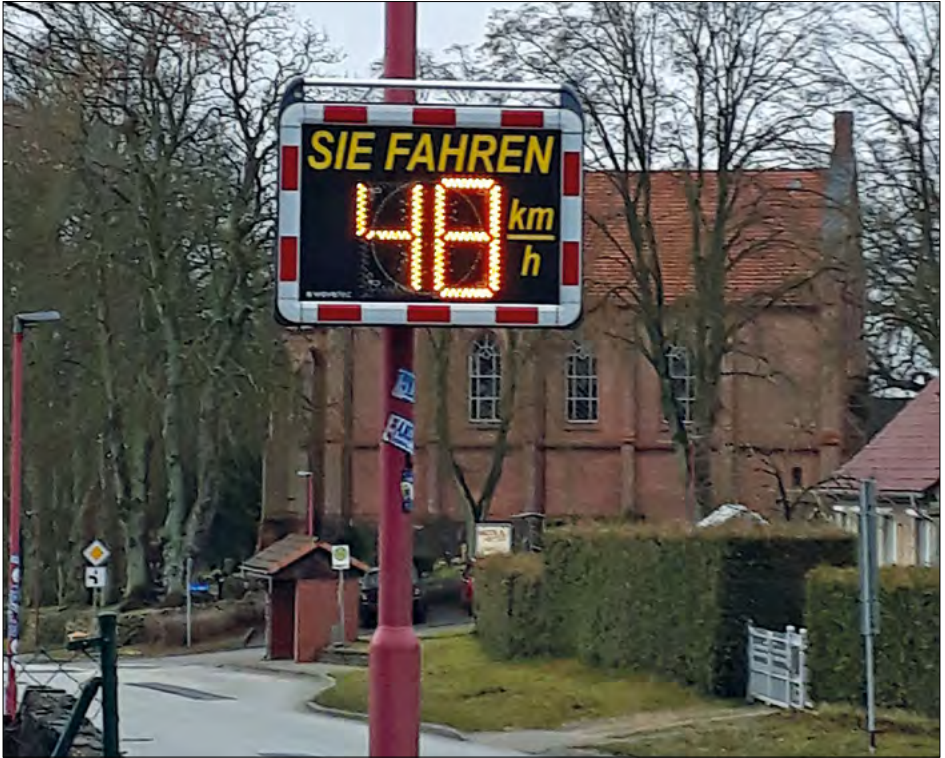
Wirkt auch: Verkehrsanzeige